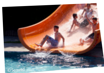
Freibad in Wolkersdorf