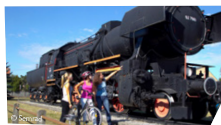
Die alte Dampflok

Hier geht's lang! Diese Schilder zeigen dir den Weg!