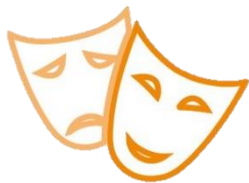
Kunst & Kultur